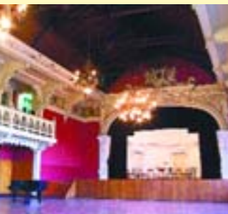
Salón Colegio Alemán

Seguimos el recorrido por la calle Abtao, donde hay también casonas emblemáticas que vale la pena contemplar para apreciar los detalles arquitectónicos de su ornamentación. Hay escalinatas de mármol, balcones en madera, ventanas con visillos y mamparas relucientes con placas de bronce.