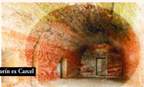
Polvorín ex Cárcel

Esta etapa termina en el nuevo Centro Cultural de la ex Cárcel. Este sitio fue considerado por la Fundación Guggenheim por el Guggenheim Latinoamericano, pero el apoyo de un empresario brasileño llevó el proyecto a Sao Paulo. Hoy la ex cárcel opera como un activo centro cultural. Vale la pena visitar el polvorín, construido en la época de la colonización española hace más de 200 años.