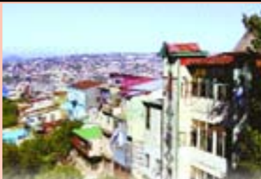
Vista desde la Avenida Alemania

te panorámica a la ciudad. En la quebrada se asoman las galerías vidriadas de una casona de madera de muchos pisos fechada en 1922, con el número bien visible. Tienen entrada por un costado. Esta parte corresponde al fondo de la casa con vista al barranco. Vemos la intimidad de las familias: la ropa colgando en las lienzas, típica escena porteña. Todo el cerro tiene aromos y paltos escalonados en la quebrada. La avenida Alemania tiene enormes pitosporos que la bordean. A un costado, se ven añosos árboles. Tras sus ramajes está el Hospital Alemán, construido a fines del siglo XIX por las familias alemanas del cerro. Se conserva tal como era en sus tiempos, con sus clásicos colores verde y amarillo, sus patios y corredores. Allí trabajaron importantes médicos alemanes del cerro. Paciente del Hospital Alemán fue el poeta Carlos Pezoa Véliz.